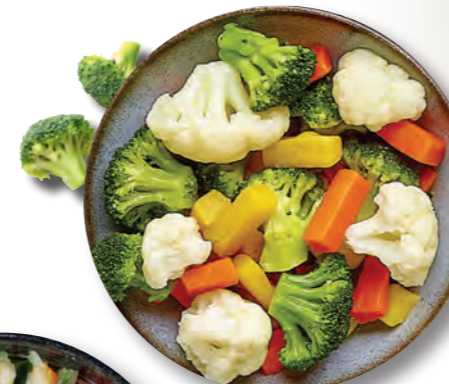
0700 Gemüsebrunoise 120 5 5 500 g | Fr. 7.55 | 100 g = Fr. 1.51 |