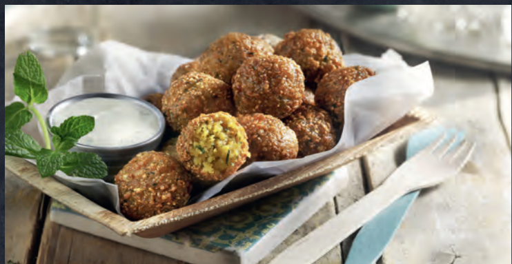
11496 Falafel 18 10 500 g | Fr. 15.50 | 100 g = Fr. 3.10 |