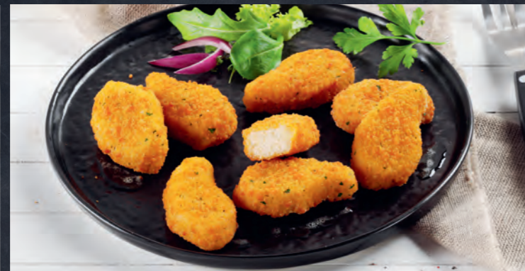
10577 VEGANTische Nuggets aus Reis 7 5 17 7 500 g | Fr. 12.95 | 100 g = Fr. 2.59 |