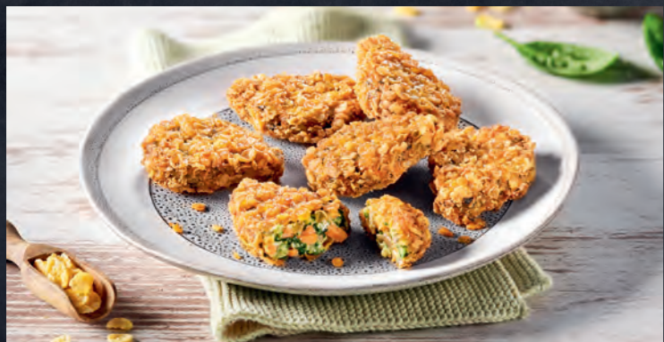
11708 Crunchy Nuggets „Karotte-Spinat“ 10 15 8 5 480 g | Fr. 13.60 | 100 g = Fr. 2.83 |