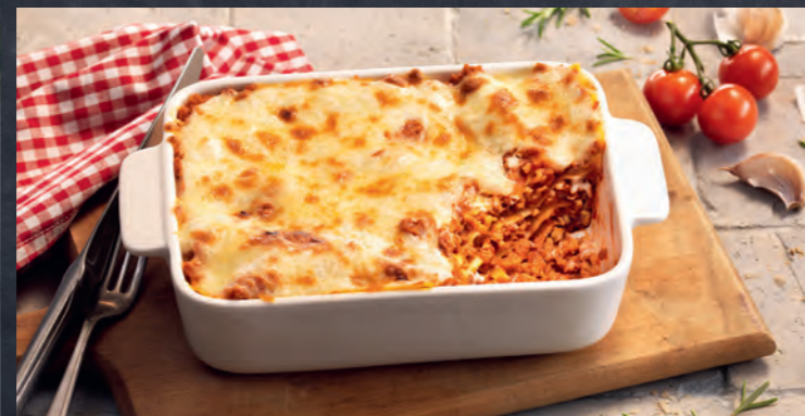
10523 Veggie Lasagne „Bolognese“ 35 12 2 Stück = 800 g | Fr. 17.95 | 100 g = Fr. 2.24 |

Profitieren Sie im Zeitraum 06.01.-19.01.25 von doppelten bofrost* Home Punkten!