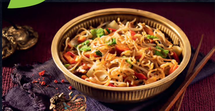
1270 Chinesische Bratnudeln 7 8 1000 g | Fr. 16.95 |