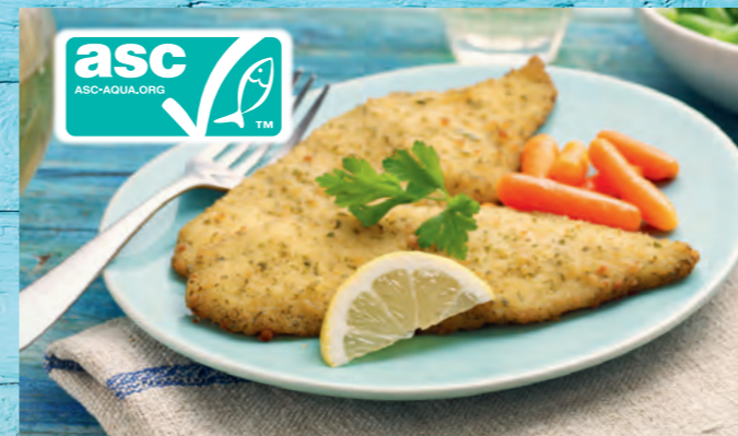
5557 Tilapia „Limona“ 10 18 6-10 Stück = 700 g | Fr. 24.95 | 100 g = Fr. 3.56 |