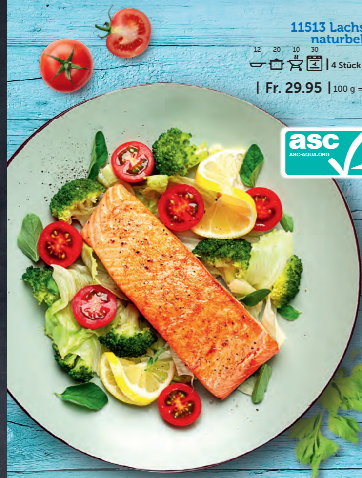
11513 Lachsfilets, naturbelassen 12 20 10 30 4 Stück = 480 g | Fr. 29.95 | 100 g = Fr. 6.24 |