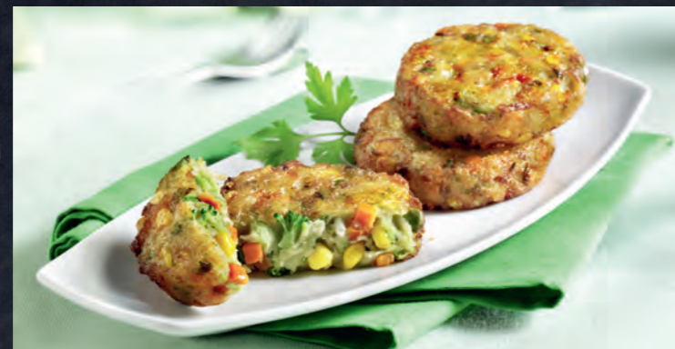
4742 Gemüse-Burger 10 14 9 Stück = 720 g | Fr. 18.95 | 100 g = Fr. 2.63 |